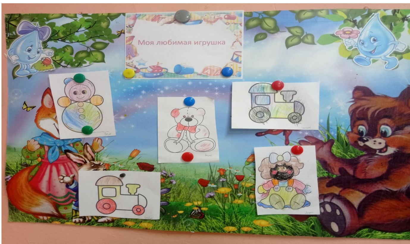
Экскурсия по детскому саду

Организация выставки рисунков «Моя любимая игрушка в детском саду»